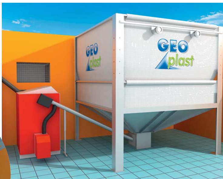
Exemple d'installation pour une chaudière dotée de sa propre lance d'extraction