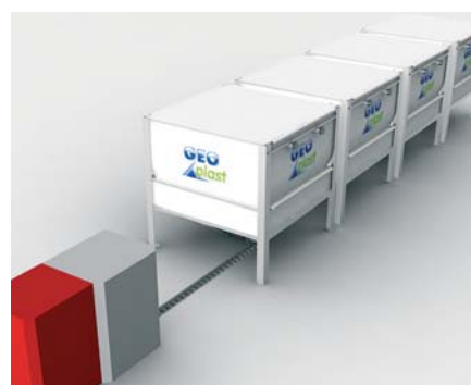
Installation pour système combiné