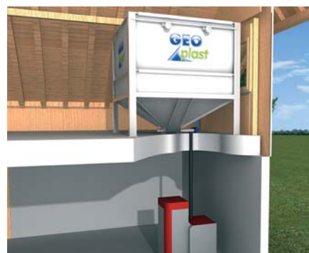
Installation avec un tuyau de descente