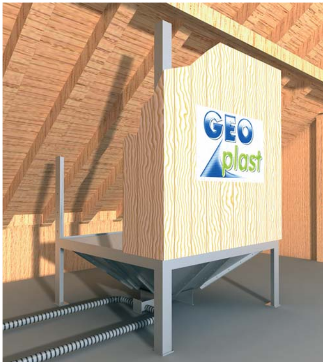
Installation au grenier