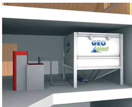
Installation avec système d'aspiration