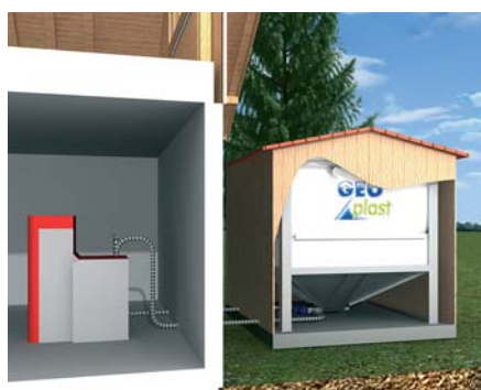
Installation à l'extérieur