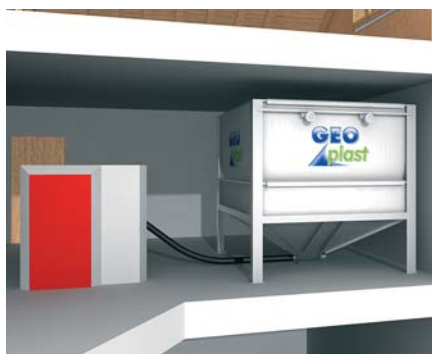
Installation avec une vis sans fin flexible