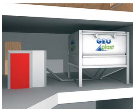
Installation avec une vis coudée