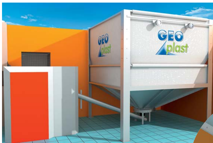
Variante de mise en oeuvre pour vis ascendante en détail