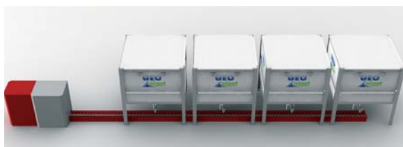
Exemple d'installation pour connexion en cascade