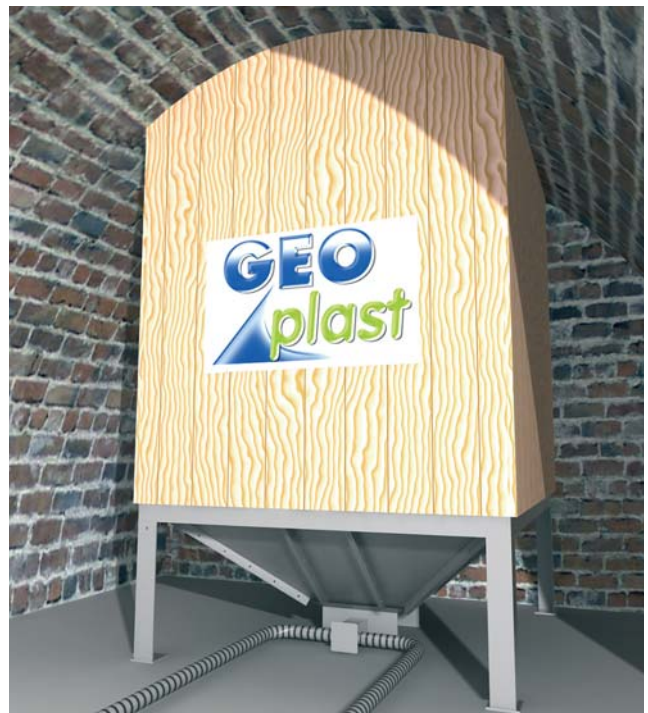
Installation dans une cave voûtée